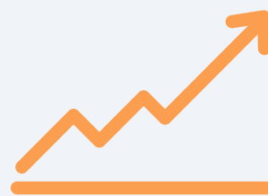
Childhood Autism Rating Scale (CARS).