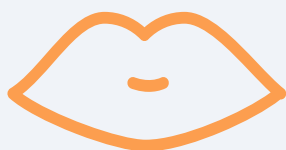
Autism Diagnostic Interview - Revised (ADI-R)