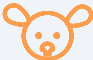
Autism Diagnostic Observation Schedule (ADOS)