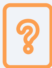
Checklist for Autism in Toddlers (CHAT).